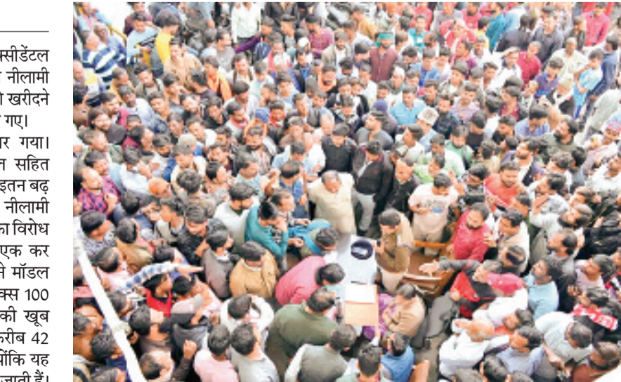
कई खरीदारों ने एक साथ कई गाड़ियां खरीदीं जिन्हें मॉडिफाइ करने के बाद बाजार में ऊंचे दामों पर बेचा जाएगा। यह गाड़ियां कई सालों से थाना परिसर में खड़ी हुई थीं।

हरिभूमि न्यूज विदिशा शनिवार को कोतवाली थाने में जब्त, एक्सीडेंटल और अपराधों में पकड़ी गई गाड़ियों की नीलामी हुई। कंडम हालत में पड़ी इन गाड़ियों को खरीदने के लिए सैकड़ों की संख्या में लोग पहुंच गए। पूरा थाना परिसर खचाखच भर गया। वाहनों को खरीदने के लिए भोपाल सहित आसपास से भी खरीददार पहुंचे। भीड़ इतन बढ़ गई कि पुलिस ने लॉट में गाड़ियों की नीलामी शुरू कर दी। लेकिन खरीददारों ने इसका विरोध कर दिया इसके बाद फिर से एक- एक कर बाइकों की नीलामी की गई। कई पुराने मॉडल की गाड़ियों जैसे एजदी, याम्हा आरएक्स 100 जैसी मॉडिफाइ होने वाली गाड़ियों की खूब ऊंची बोली लगाई गई। एक एजदी करीब 42 हजार रुपए कीमत में नीलामी हुई। क्योंकि यह गाड़ियां तैयार कर ऊंची दामों पर बिक जाती हैं। कोतवाली थाने में दोपहर से शुरू हुई गाड़ियों की नीलामी रात 9 बजे के बाद तक चलती रही।