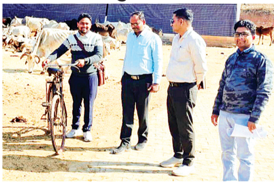
हरिभूमि न्यूज ललितपुर

ग्राम पंचायत सचिवों द्वारा पंचायत सचिव की उपस्थिति को ऑनलाइन किये जाने को लेकर जो आदेश विगत दिनों निर्गत किया गया था। ऑनलाइन उपस्थिति आदेश के परिप्रेक्ष्य में ग्राम पंचायत सचिवों द्वारा इसे वर्तमान समय में ऐसे आदेश को अव्यवहारिक और शासकीय कार्यों को बाधित करने वाला बताते हुये सांकेतिक सत्याग्रह