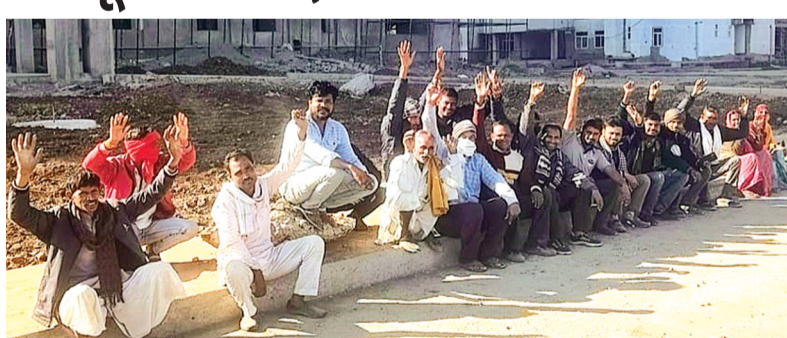
हरिभूमि न्यूज ॥ राजगढ़

जिले के लिए बड़ी सौगात माने जा रहे करीब 220 करोड़ की लागत वाले मेडिकल कॉलेज का निर्माण शुरूआत से ही कड़ुआ गति से चल रहा है। अपनी तय अवधि से करीब ढाई साल पीछे चल रहे इस चिकित्सा महाविद्यालय के निर्माण में पिछले कुछ महीनों से तेजी आने के बाद अब फिर से काम की गति धीमे होने की संभावना है। दरअसल, कॉलेज बिल्डिंग के निर्माण विभिन्न सप्लायरों के माध्यम से लगे करीब 120 मजदूरों को निर्माण एजेंसी से बीते तीन महीनों से उनकी मजदूरी का भुगतान नहीं किया है। राजगढ़ जिले सहित अन्य राज्यों से रोजी-रोटी की तलाश में यहां काम करने आए इन मजदूरों को तीन माह (सितंबर, अक्टूबर, नवंबर) से एजेंसी ने उनकी मजदूरी/महनताने का भुगतान नहीं किया है। एजेंसी के अधिकारियों से बार-बार गुहार लगाने के बाद भी जब मजदूरों को उनका भुगतान नहीं